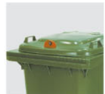
serrature coperchio a gravità e/o con chiave gravity and/or with key locks for closing the lid serrure couvercle automatique et / ou à clé