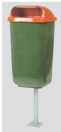
paletto in acciaio zincato galvanized iron pole poteau en acier zingué