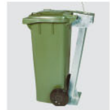
paletto antifurto disponibile per lt 80, 120, 240 theft-proof post - available for lt 80, 120 and 240 lts models poteau antivol (seulement pour 80 L, 120 L et 240 L.)