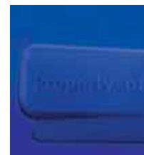
marcature a rilievo engraving marquage en relief