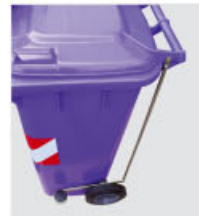
pedaliera lid opening foot pedal ouverture couvercle à pédale