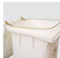
anello reggisacco disponibile per lt 120, 140, 240 bag-holding ring available only for 120, 140 and 240 lts models bague porte-sac (seulement pour 120 L, 140 L et 240 L.)