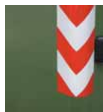
striscie rifrangenti classe 1 e/o 2, adesivi reflective stickers class one and two, adhesives bandes réfléchissantes classe 1 et/ou 2, autocollants