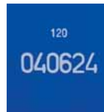
incisioni numeriche progressive progressive serial number printing numérotation